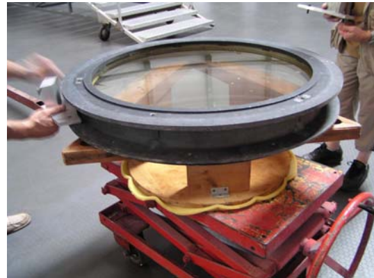
Démontage de l'objectif.