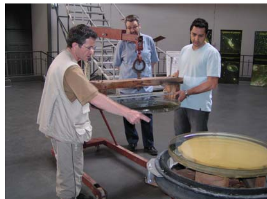
Séparation des deux lentilles de 76 cm.